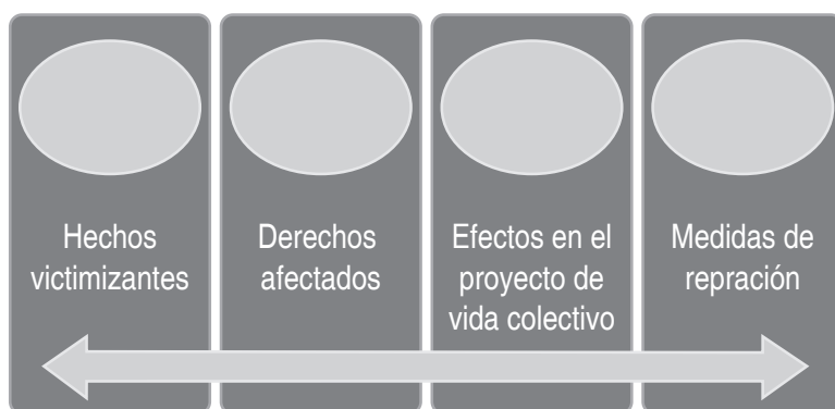
Gráfico 1: Itinerario y elementos del proceso de reparación colectiva del sindicalismo

Transformaciones en el contexto favorables al ejercicio de la actividad sindical